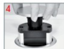
NETBOX Move bis zur Endposition herausziehen Pull out the NETBOX Move til the endposition