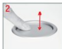
Verrastung durch Druck auf Deckel ent- / verriegeln Release / lock the unit by pressing the lid