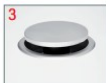
Verrastung entriegelt Locking released