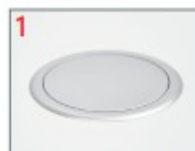
NETBOX Move geschlossen NETBOX Move closed